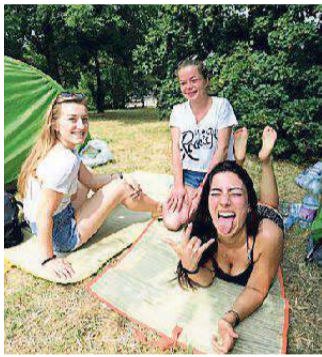
Alcuni degli appassionati di Vasco già arrivati a Modena con tende e camper. Accanto le tende al parco Ferrari