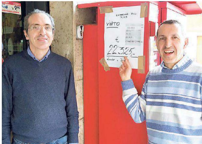
Gran vincita alla tabaccheria Muratori di Castelnuovo: vinti oltre 22mila euro

La dea bendata bacia ancora la tabaccheria Muratori di Castelnuovo. Nell'estrazione del Lotto di martedì, infatti, un fortunato giocatore è riuscito a centrare un terno e tre ambi, portandosi a casa la bellissima somma di 22mila e 325 euro. I numeri giocati sono stati il 5, il 24 e il 75 sorteggiati sulla ruota di Napoli. D'altronde la tabaccheria Muratori di via Achille Ferrari non è nuova a colpi di fortuna del genere: a dicembre un altro scommettitore aveva vinto quasi 10mila euro sempre al Lotto. (gib)