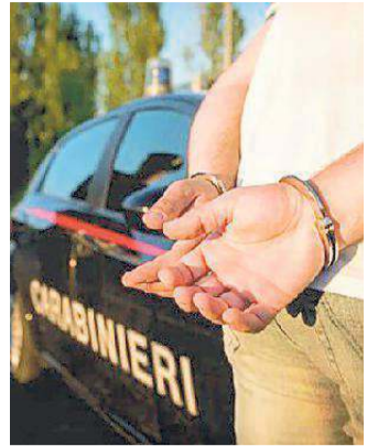
Arrestati tre giovani clandestini

breve indagine ed aver appurato che cosa stesse succedendo, passano all'azione. In manette sono finiti i tre giovani marocchini, che sono risultati anche essere irregolari sul territorio nazionale. L'accusa per loro è furto aggravato di energia in corso. (gib)