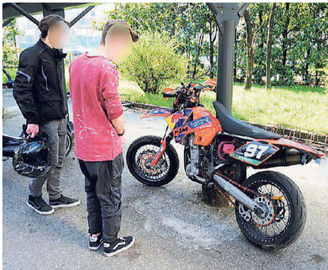
La moto Ktm che ieri ha investito uno studente appena fuori dal Levi

Vignola. Il 16enne usciva dal Levi ed è stato colpito dal mezzo sfuggito al controllo di un compagno